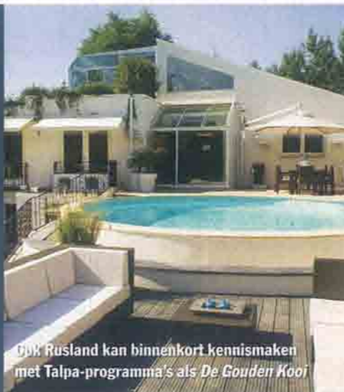
Druk Rusland kan binnenkort kennismaken met Talpa-programma's als De Gouden Kooi